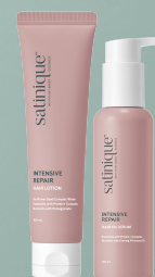
ESTILIZA CREMA Y SUERO