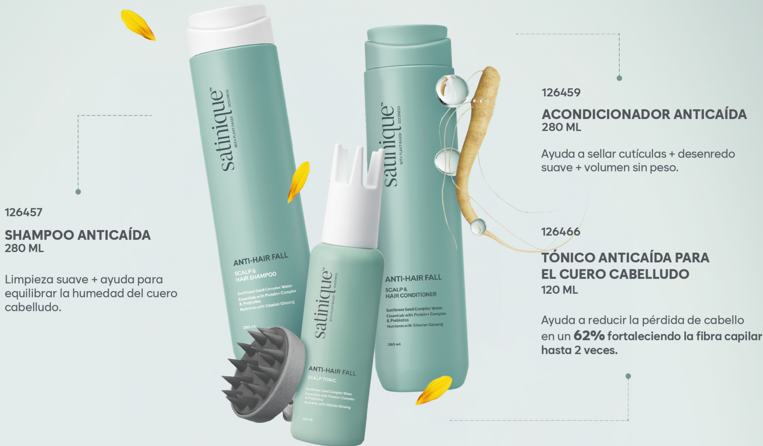
126457 SHAMPOO ANTICAÍDA 280 ML

Con tecnología de fitoliposomas para ayudar a equilibrar la humedad y mantener la barrera de hidratación del cuero cabelludo.