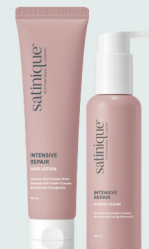
ESTILIZA CREMA Y SUERO

*Imagen del masajeador es de carácter ilustrativo. El uso de un masajeador es una recomendación de herramienta para incluir en la rutina de cuidado capilar, sin embargo, este paso es solo una sugerencia, puede realizarse con los dedos u omitirse.