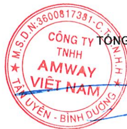
HUỶNH THIÊN TRIỀU

Điều 3: Quyết định có hiệu lực kể từ ngày ký.