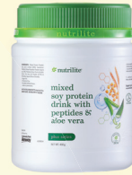
1x Nutrilite 植物双肽 芦荟大豆蛋白质饮料 - 450g