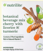
1x Nutrilite 樱桃甘草和姜黄综合 植物饮品 - 5g x 30 包