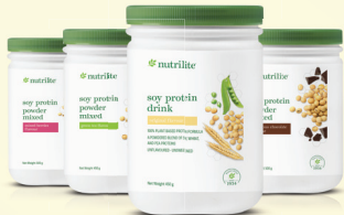
1x Nutrilite 大豆蛋白质饮料 450g/500g (任何口味)