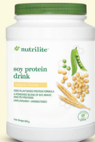
1x Nutrilite 大豆蛋白质饮料 - 900g