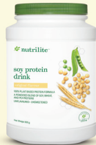
1x Minuman Protein Soya Nutralite – 900g