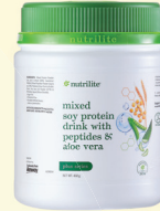
1x Minuman Protein Soya Campuran Dengan Peptida & Aloe Vera Nutralite – 450g