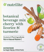
1x Nutralite Botanical Beverage Mix Cherry With Licorice & Turmeric – 5g x 30 pek batang