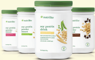
1x Minuman Protein Soya Nutralite 450g/500g (sebarang perisa)

Dapatkan produk tunggal untuk menyasarkan keperluan kesihatan & kecantikan khusus anda