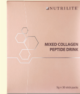
1x Minuman Peptida Kolagen Campuran Nutralite – 5g x 30 pek batang