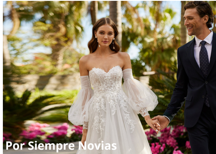
Por Siempre Novias

Nevada ha llegado a todo Chile, pero también ha cruzado fronteras con novias de Estados Unidos, México, Colombia, Brasil y muchas otras partes del mundo.