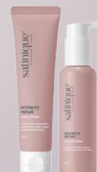
ESTILIZA CREMA Y SUERO

*Imagen del masajeador es de carácter ilustrativo. El uso de un masajeador es una recomendación de herramienta para incluir en la rutina de cuidado capilar, sin embargo, este paso es solo una sugerencia, puede realizarse con los dedos u omitirse.