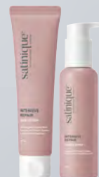
ESTILIZA CREMA Y SUERO

*Imagen del masajeador es de carácter ilustrativo. El uso de un masajeador es una recomendación de herramienta para incluir en la rutina de cuidado capilar, sin embargo, este paso es solo una sugerencia, puede realizarse con los dedos u omitirse.