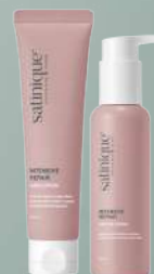
ESTILIZA CREMA Y SUERO

*Imagen del masajeador es de carácter ilustrativo. El uso de un masajeador es una recomendación de herramienta para incluir en la rutina de cuidado capilar, sin embargo, este paso es solo una sugerencia, puede realizarse con los dedos u omitirse.