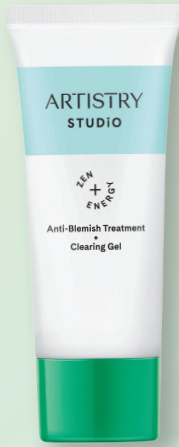
ARTISTRY STUDIO GEL LIMPIADOR CONTROL DE IMPERFECCIONES