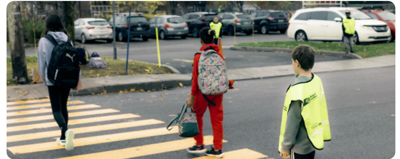
École Saint-Mathieu, Québec