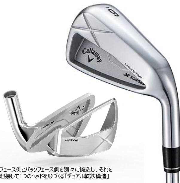
フェース側とバックフェース側を別々に鍛造し、それを溶接して1つのヘッドを形づくる「デュアル軟鉄構造」