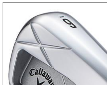
X FORGED MAXアイアンよりも大きめに入れられているXの文字のアクセント

「X FORGED MAX STARアイアン」の番手ラインアップは、I#4～9、PWの7本となっています。I#4、5は単品で、I#6～9、PWは5本セットでの発売となります。ロフトはX FORGED STARアイアンよりも1度寝ている設定で、I#7が30度です。シャフトには2種類のスチールモデルと1種類のカーボンモデルを用意しています。