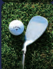
オープンに構える