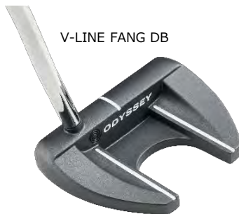
V-LINE FANG DB