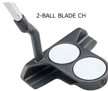
2-BALL BLADE CH