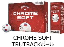
CHROME SOFT TRUTRACKボール

アライメント用のラインを中心にして、その両 サイドに位置する同一線上の一辺も利用す ると、正確なセットアップと、ボールの 転がりの認識がしやすい