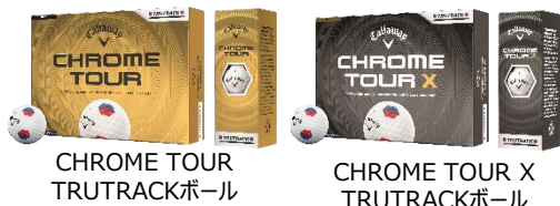
CHROME TOUR TRUTRACKボール

CHROME TOURシリーズ TRUTRACKボール 【価格】オープンプライス