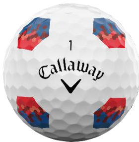
CHROME TOUR X TRUTRACKボール

赤と青が混ざり合った、独特のデザイン の六角形スタンプを計8個、カバ ーに描いている