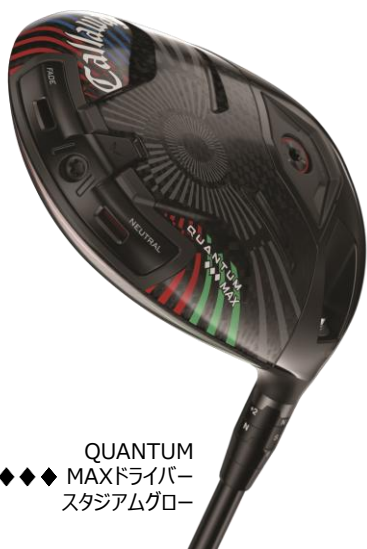
◆◆◆ QUANTUM MAXドライバー スタジアムグロー