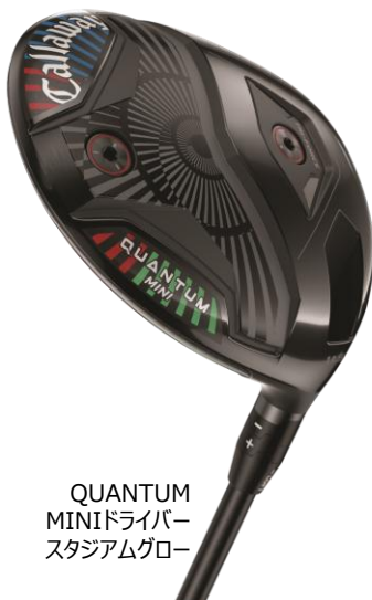
QUANTUM MINIドライバー スタジアムグロー