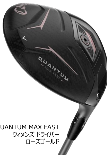
QUANTUM MAX FAST ウイメンズ ドライバー ローズゴールド