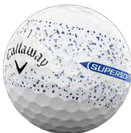
スプラッターデザイン ブルー