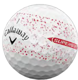
スプラッターデザイン レッド