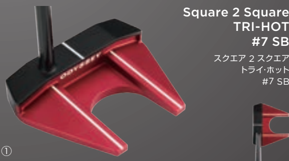
Square 2 Square TRI-HOT #7 SB