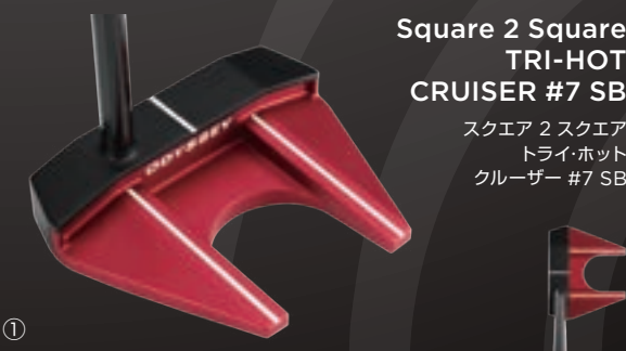
Square 2 Square TRI-HOT CRUISER #7 SB