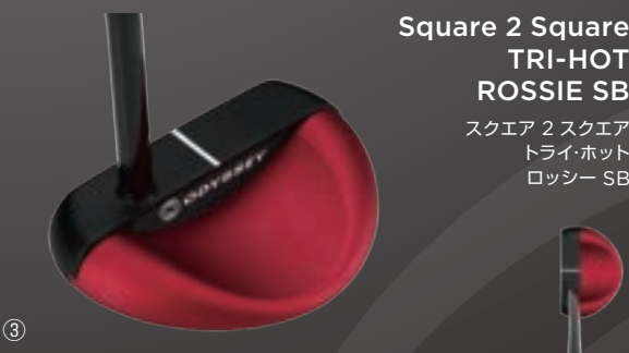
Square 2 Square TRI-HOT ROSSIE SB