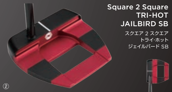
Square 2 Square TRI-HOT JAILBIRD SB