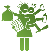
忙碌的为人父母者