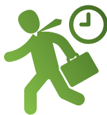
行程繁忙的上班族