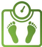
在意体重的成年人