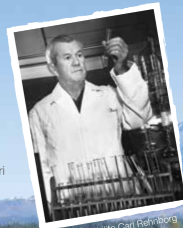
Pengasas Nutrilite Carl Rehnberg

Bermula dari biji benih yang kami semai di ladang-ladang kami, helang yang menghalau burung-burung daripada memakan tanaman kami, menggabungkan nutrien tumbuhan di makmal penyelidikan kami, sehingga mencari suplemen kesihatan yang seterusnya, kami sangat terperinci semenjak Carl Rehnberg mengetahui bahawa suplemen yang bagus bermakna terbaik dari dua dunia – Terbaik dari Alam, Terbaik dari Sains.