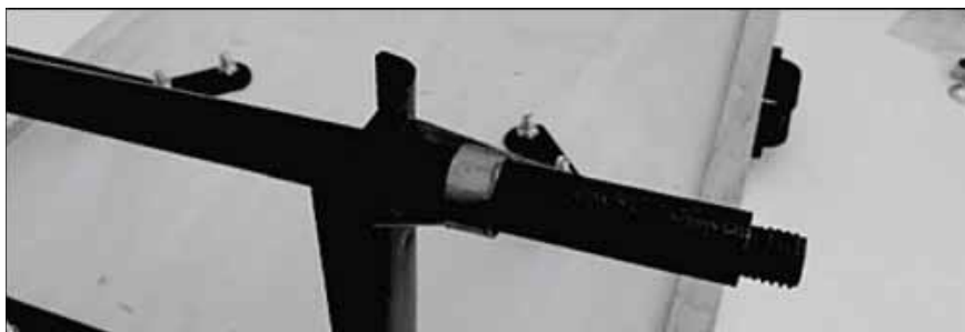
Figure 2 : Glissez l'espaceur sur l'essieu, comme illustré.