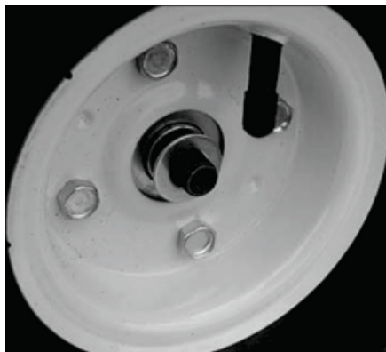
Figure 3 : Glissez la roue ou le patin, puis la rondelle, sur l'essieu.