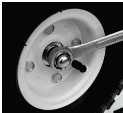
Figure 4 : Vissez l'écrou au bout de l'essieu et serrez-le avec une clé.