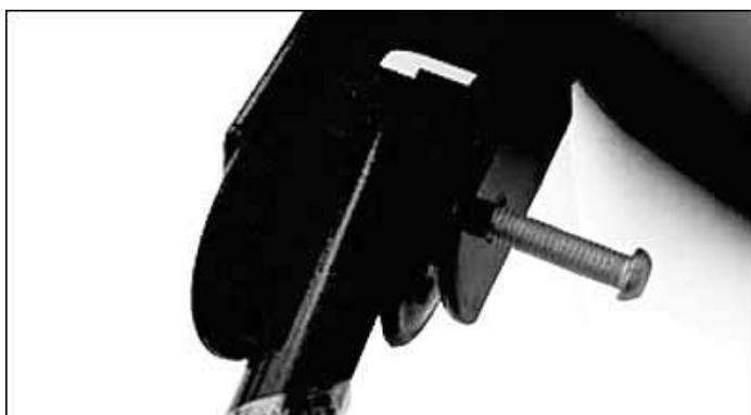
Figure 5 : À l'aide du boulon, assemblez la poignée à la direction. Serrez bien le boulon. Félicitations! Votre chariot est maintenant prêt.