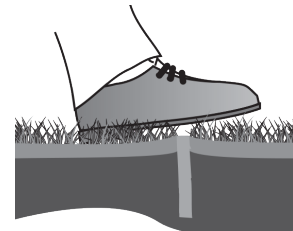
Figure 4 : Égaliser le trou.