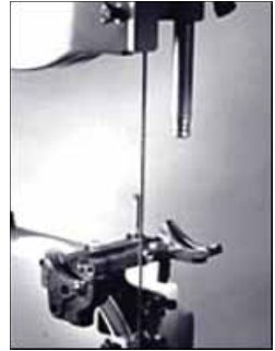
Scie à ruban Delta sans la table et le guide-lame d'origine