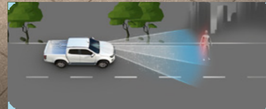
• ระบบแจ้งเตือนก่อนการชนด้านหน้า FCW (Forward Collision Warning) พร้อมระบบเบรกฉุกเฉินอัตโนมัติ AEB (Autonomous Emergency Braking)

ใหม่ล่าสุด! ระบบช่วยเหลือผู้ขับขี่ ADAS ด้วย 3D Imaging Stereo Camera ที่มีมุมมองกว้างและแม่นยำยิ่งขึ้น พร้อมเรดาร์ 2 จุด และเซ็นเซอร์ 8 จุดรอบคัน