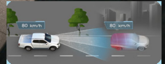
• ระบบควบคุมความเร็วอัตโนมัติแบบแปรผัน ACC (Full Speed Range Adaptive Cruise Control) พร้อมฟังก์ชัน Stop and Go