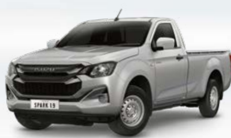
Bohemian Silver Metallic