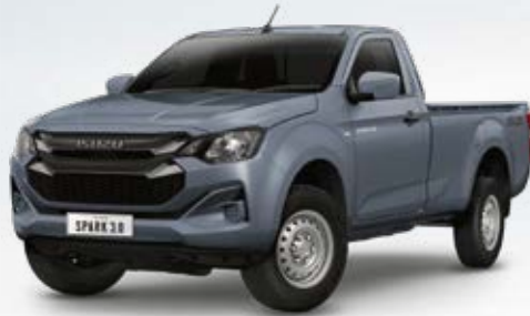
Islay Gray Opaque