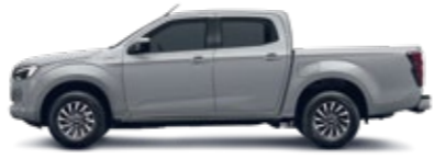
Bohemian Silver Metallic