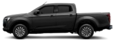
Bavarian Black Mica