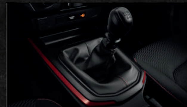
เกียร์ธรรมดา 6 สปีด แบบช่วงชักสั้น พร้อม Genius Sport Shift