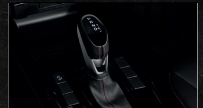
เกียร์อัตโนมัติ 6 สปีด พร้อม Rev Tronic และ Paddle Shift